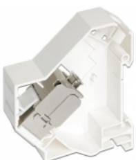
Anwendungsbeispiel mit Stecker