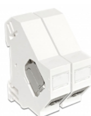
Anwendungsbeispiel mit Stecker